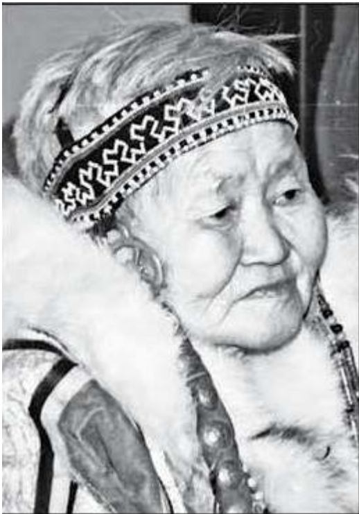
Village d'Ust' Avam.