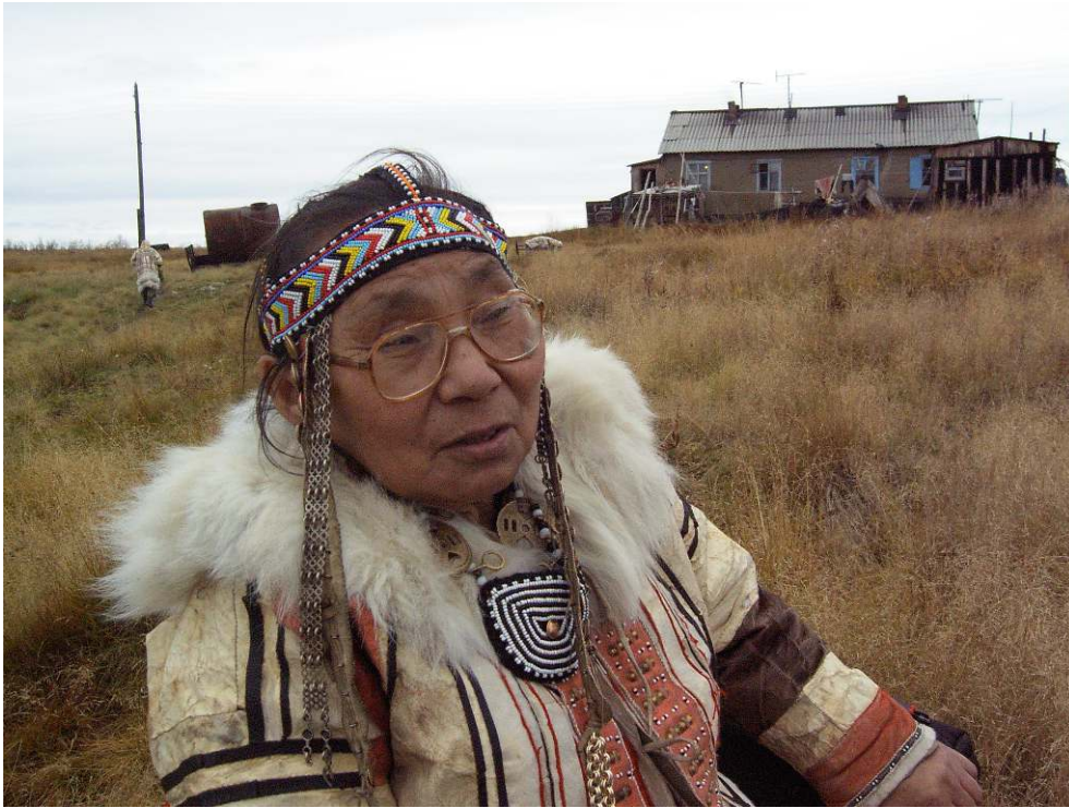
Village de Voločanka