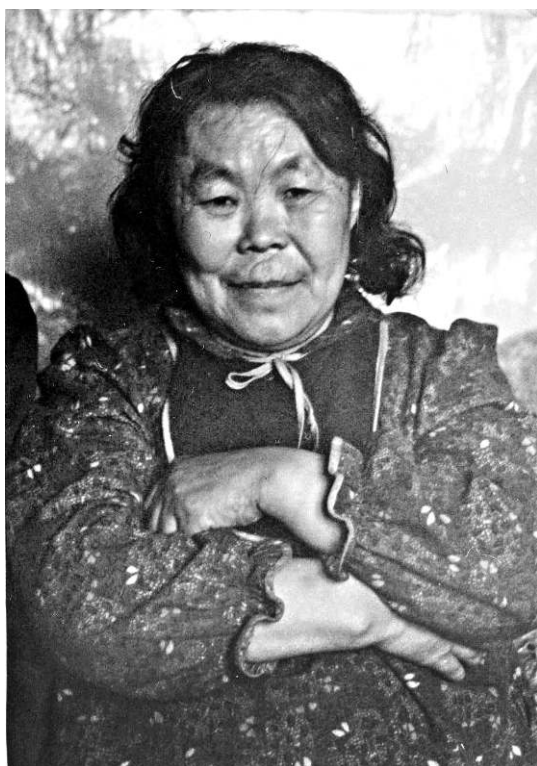
Village de Voločanka, photo de Oksana Dobžanskaja.